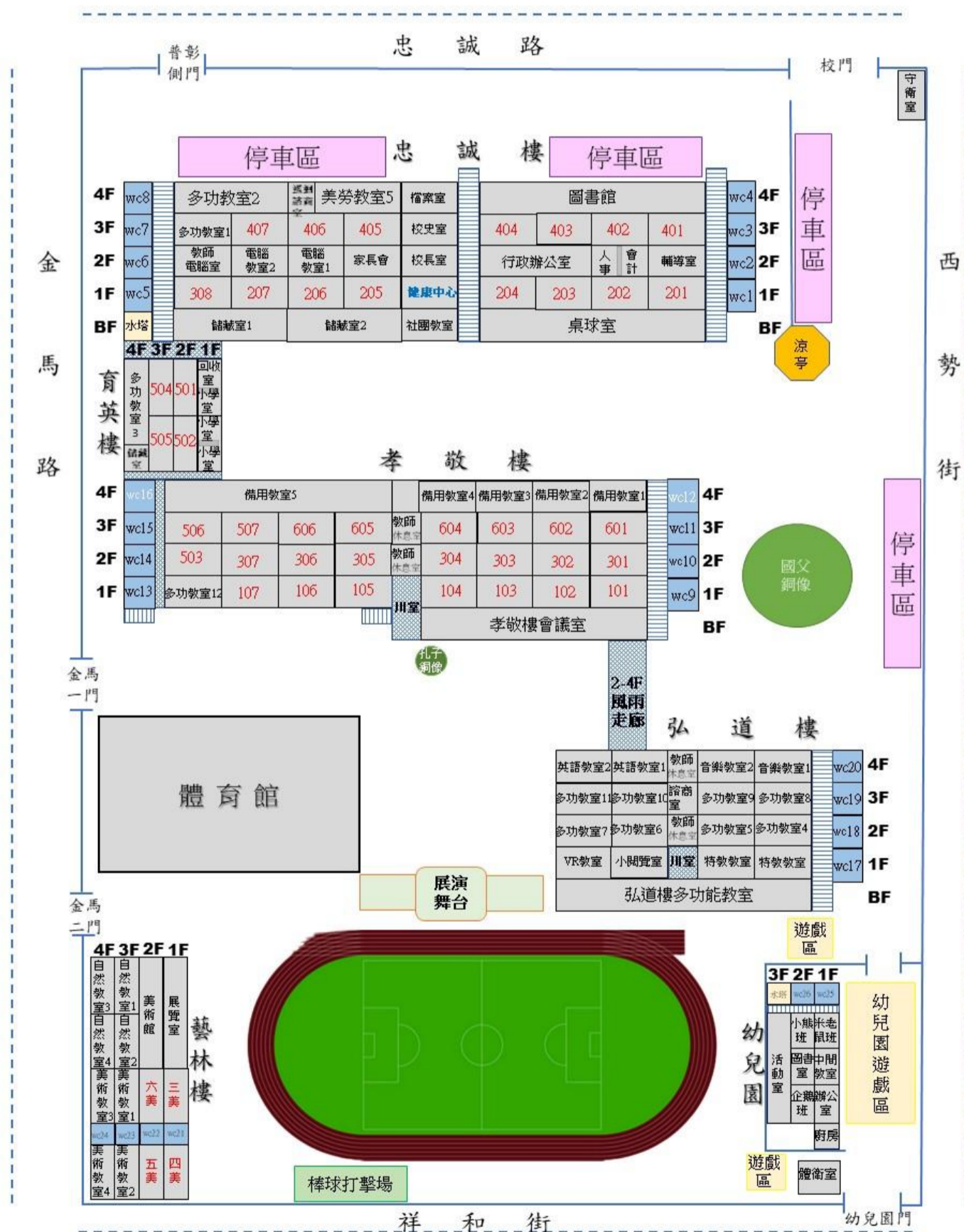
彰化縣忠孝國民小學114年度校舍配置圖